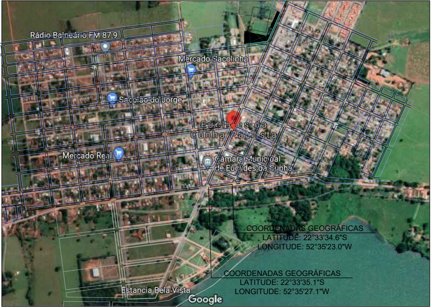
Localização sem escala