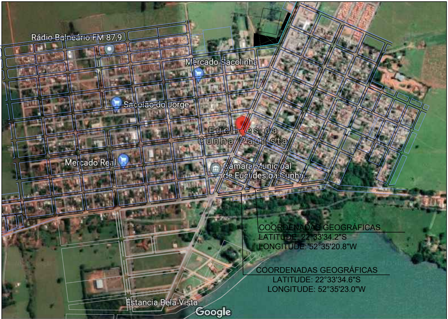
Localização sem escala